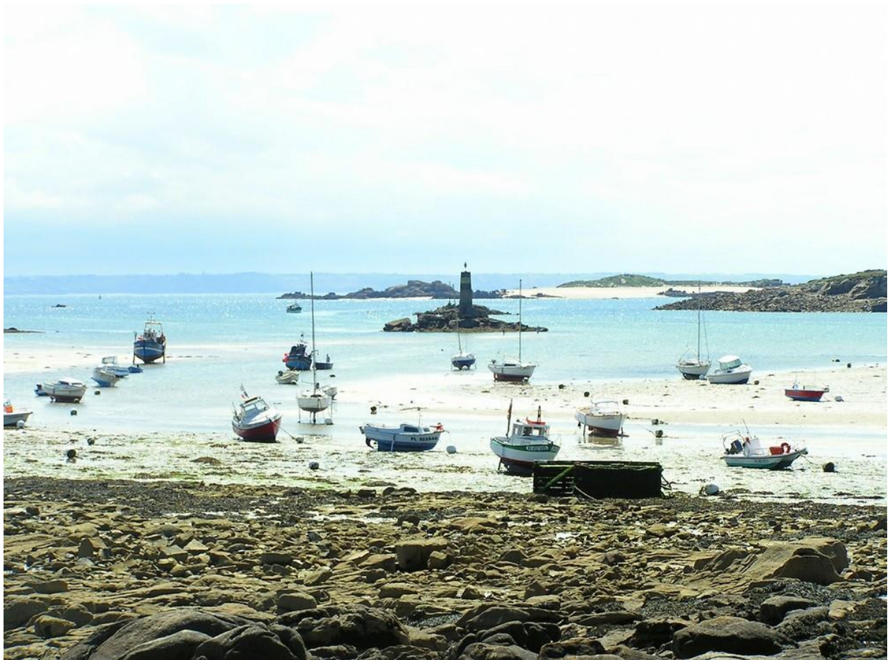
L'éstran, à marée basse, découvre le Doulin jusqu'à la balise de St Sauveur.