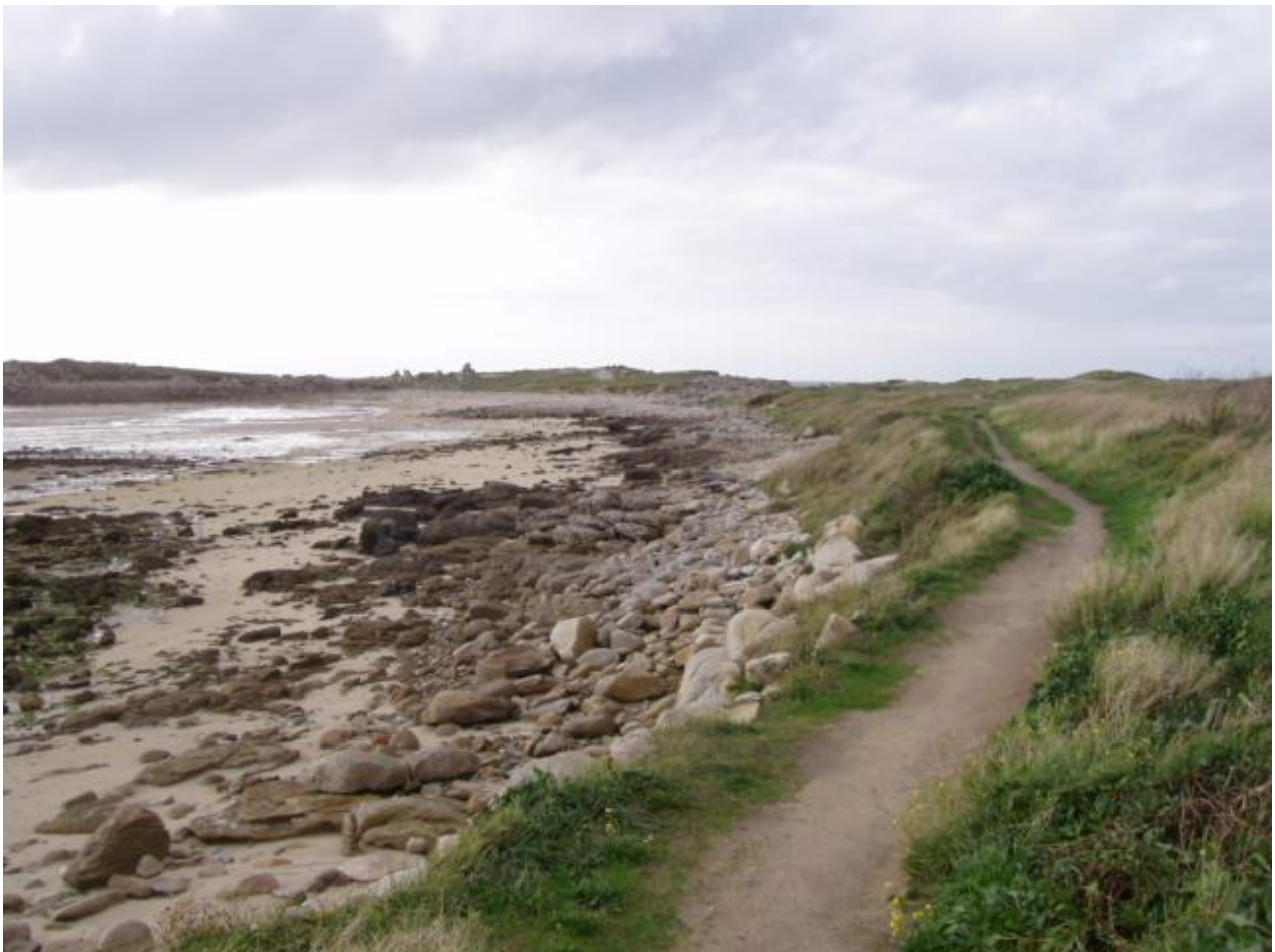
Le Dourlin et le sentier côtier, en hiver.