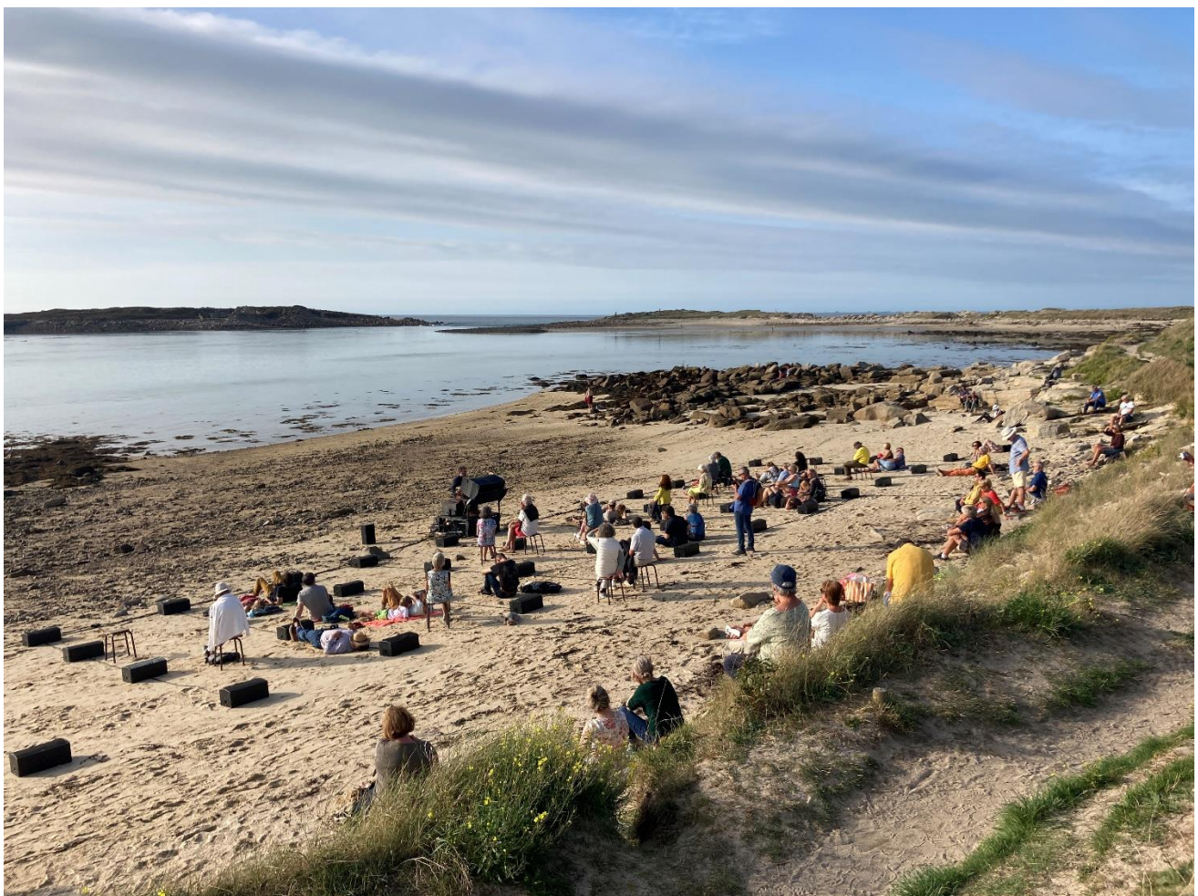
Concert acousmatique sur la plage du Dourlin, en clôture du festival de l'Estran 2023