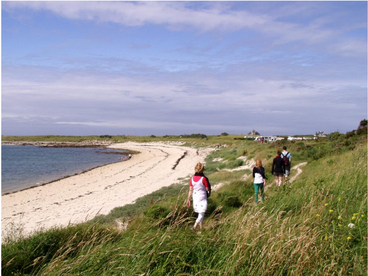
La plage du Dourlin, le sentier côtier bordant le camping municipal, en été.