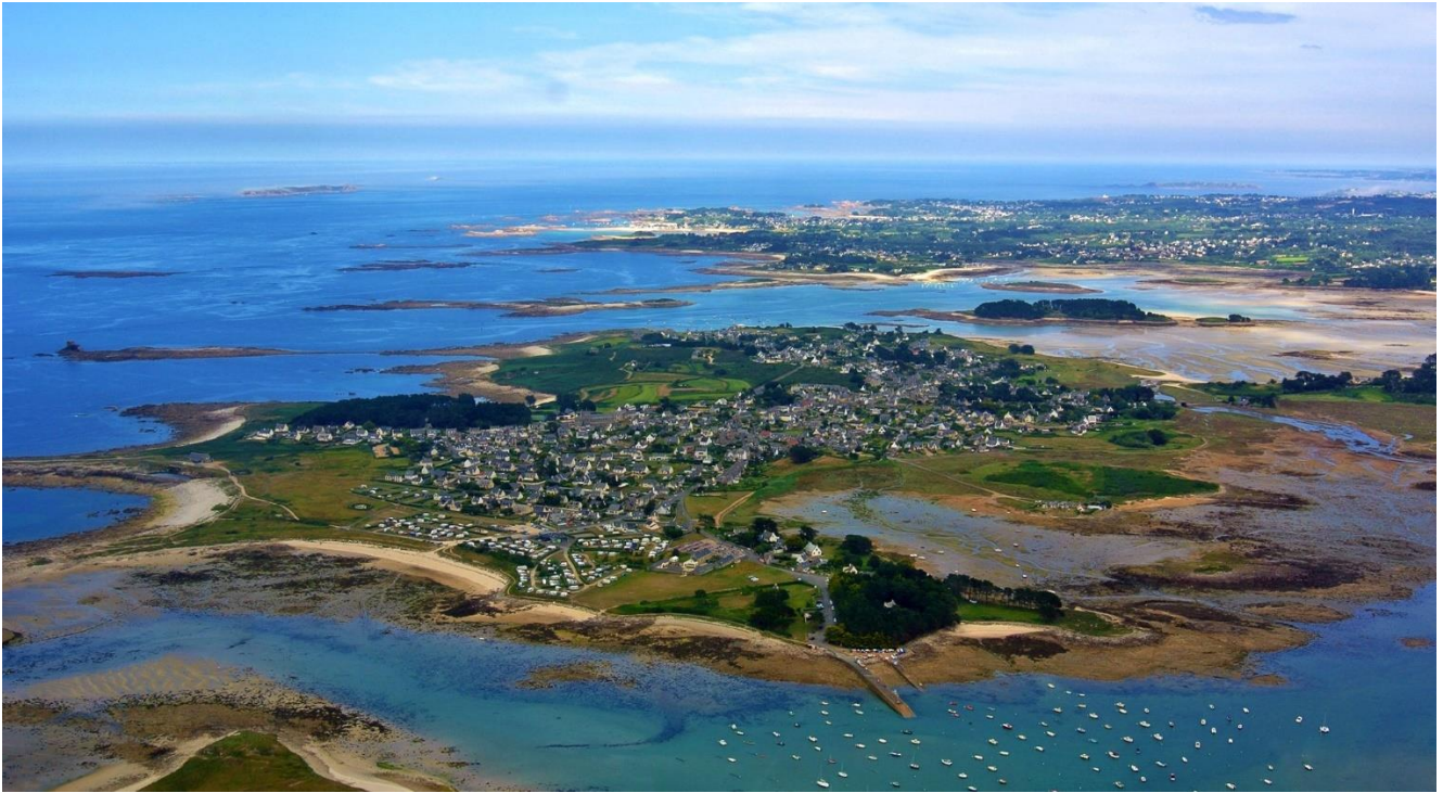
Vue aérienne de l'île-Grande ; la plage du Doulin est la plus grande, sur la gauche.