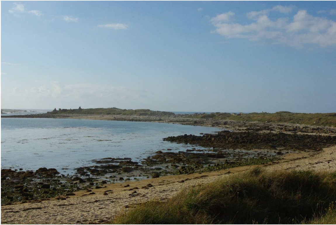
La plage du Doumlin, avec à gauche la « maison cassée ».