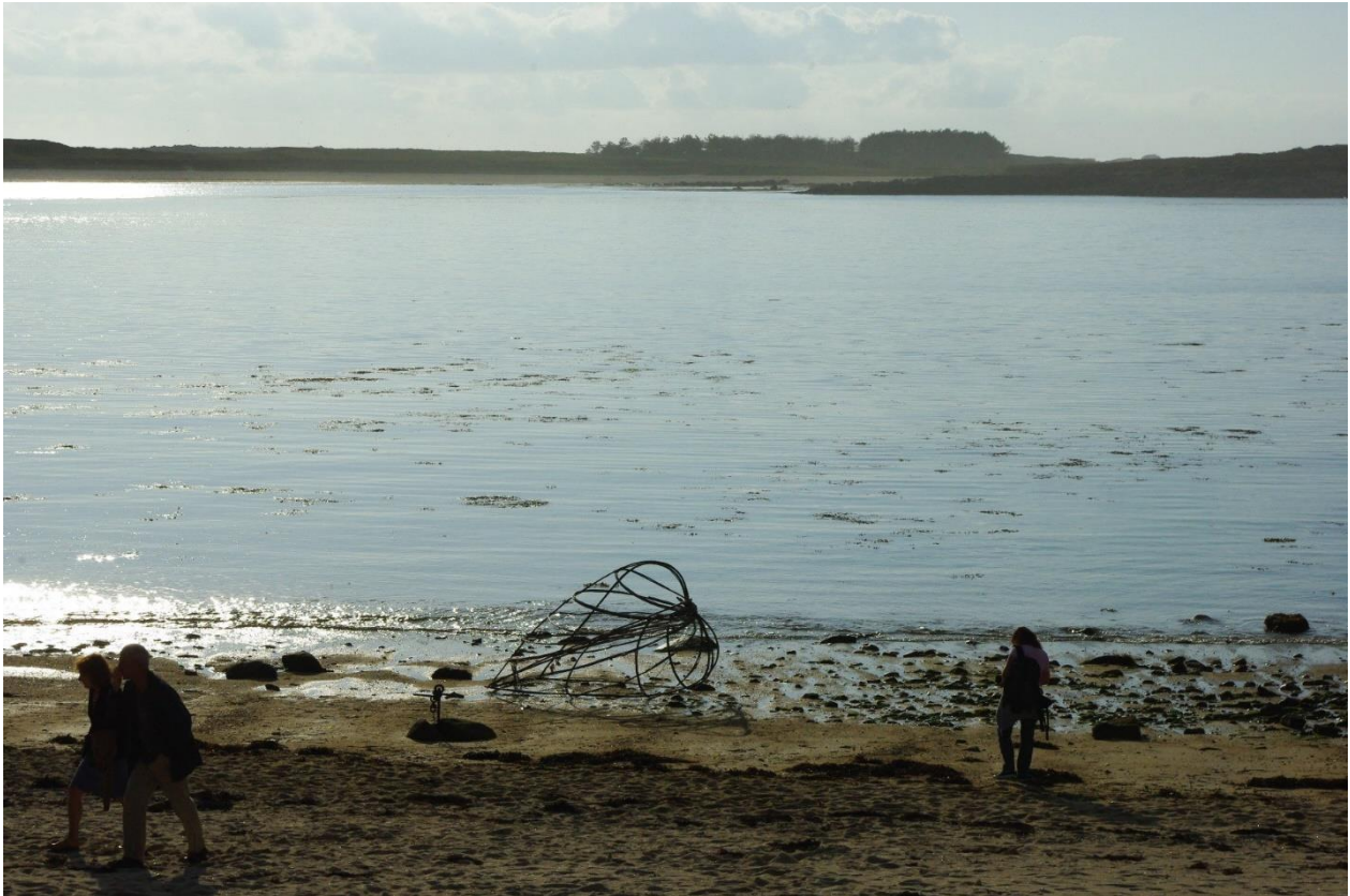
Installations de Pascale PLANCHE au Dourlin, à l'occasion du festival de l'Estran 2011