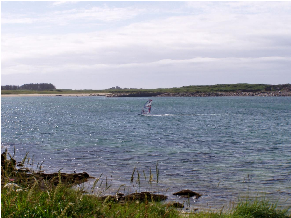
Le Doumlin à marée haute.