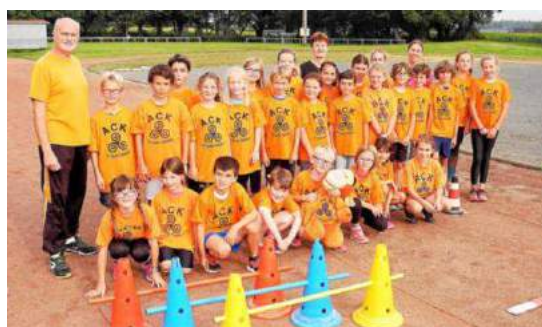
Les jeunes athlètes et leurs éducateurs.

Les enfants de l'éveil athlétique (nés en 2008) et les poussins (2006 et 2007) s'initient de façon ludique à toutes les disciplines (sauts, lancers, courses) de l'athlétisme et participeront pendant la saison à six rencontres départementales des écoles d'athlétisme.