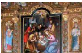
Le retable de la chapelle de Penvern, magnifiquement restauré, sera une des pièces majeures à admirer lors de ces Journées du patrimoine.

À l'occasion des Journées du patrimoine ce week-end, la commune propose plusieurs animations.