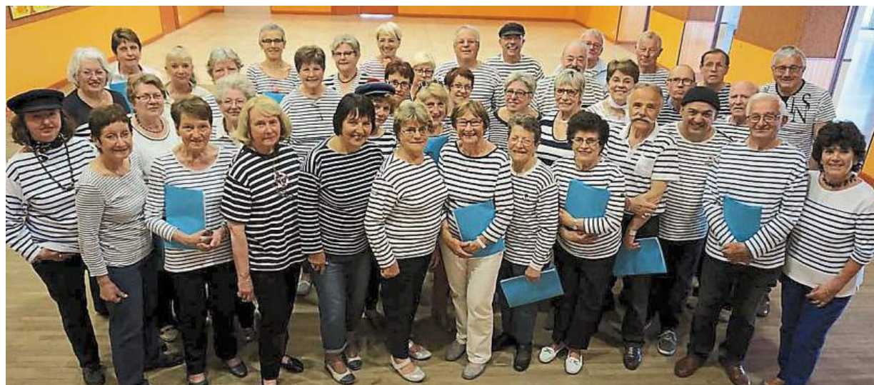
Une partie de « l'équipage » du Café du port de Balades et découverte.

Après l'été, c'est l'heure de la reprise des différentes activités de B & D.