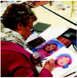
Un troisième cours de pastel, ouvert aux débutants, va ouvrir cette année.

Culture et loisirs. Quelques ateliers encore disponibles