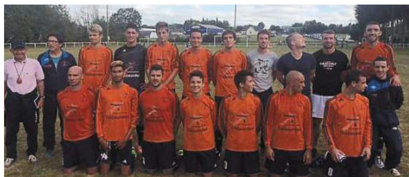
Les tangos n'ont pas fait de détail en Pays Rochois : 7-0.

Pour le 3 e tour de coupe de France, le FCTPB (Football-club Trébeurden-Pleumeur-Bodou) se déplaçait dimanche à La Roche-Derrien pour rencontrer le Pays rochois qui évolue en 2 e division. En mettant beaucoup de rythme dans la partie dès le début de match, les tangos ont fait respecter la hiérarchie. 4 à 0 à la mi-temps,