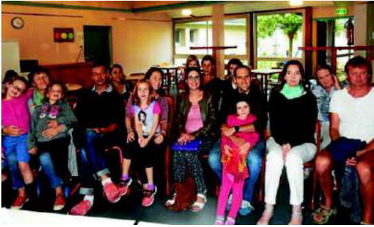
Les effectifs des classes bilingues restent stables, à la grande satisfaction des parents d'élèves de Div Yezh.