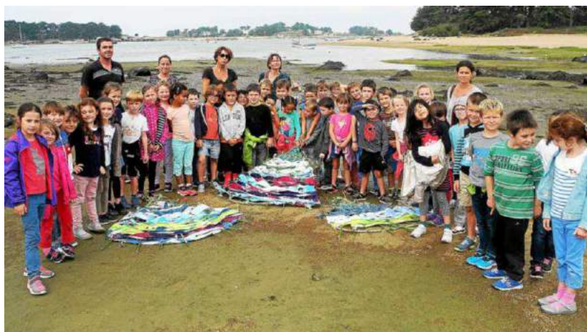
Les élèves ont posé leurs coquillages géants sur le sable au fond de la baie Sainte-Anne.

Comme chaque année, le Festival de l'estran va, une nouvelle fois, proposer ce week-end de nombreuses animations sur le littoral entre Trégastel et Trébeurden.