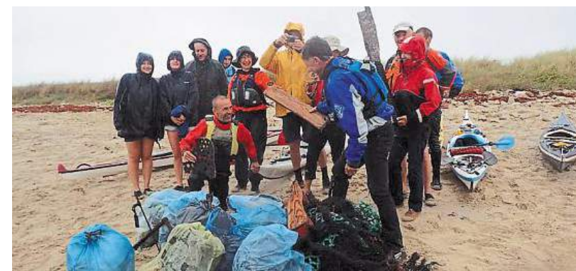
La mauvaise météo n'aura pas entamé le moral des kayakistes sur l'île Canton.

« Nous sommes des consommateurs d'environnement mais nous tenons aussi à en devenir acteurs. » Un adage qu'un groupe de kayakistes du Trégor a fait sien après le nettoyage de littoral effectué dans les environs proches de l'Île-Grande ce week-end.