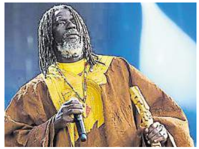
Tiken Jah Fakoly se produit ce soir à Saint-André-des-Eaux.