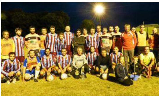
Les deux formations avant la rencontre.