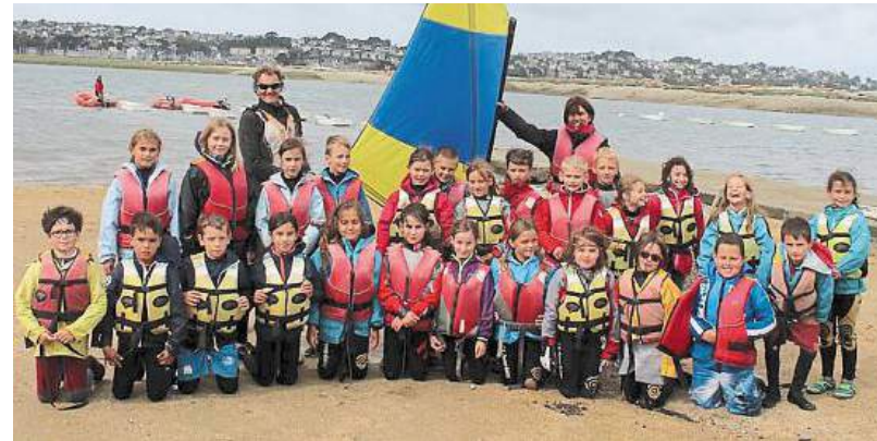
Les CM1 en classe de voile au bord du plan d'eau du Lenn.

Chaque année, avant de fermer ses portes, l'école de voile de Louannec invite les écoliers des cours moyens 1 re année à une semaine de voile.